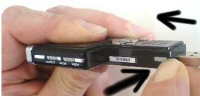
Umschalten beim 2 GB Gerät (kurz Betätigen)

Bei den 512 MB bzw. 1 GB Geräten setzen Sie den am Stromkabel endenden Batteriedummy in das Batteriefach wie eine Batterie ein. Beim Herausnehmen nicht am Kabel ziehen, sondern den Dummy mittels Fingernagel – wie eine Batterie – entnehmen.